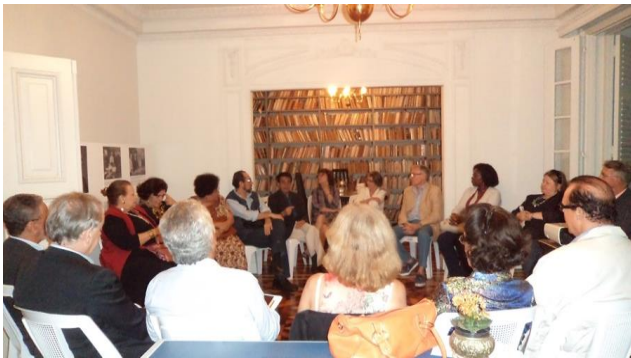
A Jangada de Pedra