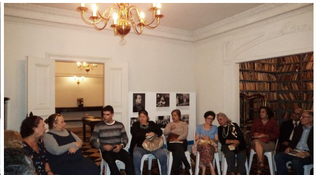
Um mapa todo seu